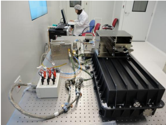
Modelo de ingeniería COLLOID (Sala Limpia E-USOC)

Hace un año se instalaba en la ISS un nuevo instrumento modular denominado SODI (Selectable Optical Diagnostics Instrument). COLLOID es uno de los experimentos del campo de la física de fluidos que forman parte de ese diseño modular, como ya lo fue IVIDIL, que estudió la influencia de las vibraciones en la difusión de fluidos y de cuya operación también se responsabilizó el E-USOC, el Centro Español de Soporte a Usuarios y Operaciones a bordo de la ISS, delegado de la Agencia Espacial Europea (ESA) y con sede en las instalaciones de la Universidad Politécnica de Madrid en el Campus de Montegancedo, recientemente reconocido como Campus de Excelencia Internacional (CEI) por el Ministerio de Educación.