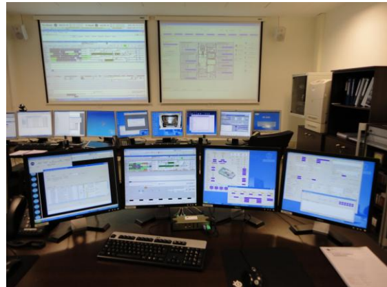
Sala de Control E-USOC (CEI Montegancedo, Universidad Politécnica de Madrid)